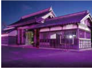
DV防止に関する啓発パープルライトアップ