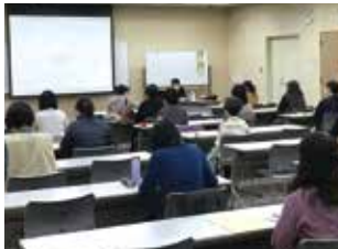
母と娘のよりよい関係づくり講座