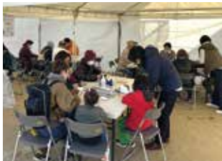
女性の視点による防災訓練

男女共同参画の推進に取り組む市民団体が、男女共同参画センターに団体登録をし、セミナーやワークショップの開催など、本市と協働して男女共同参画社会の実現に向けてさまざまな活動を行っています。