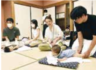
男性の家事・育児参画に向けたセミナー

セミナー等の内容は、ホームページや広報とくしま、徳島市公式SNS等で随時お知らせしますので、お気軽にご参加ください。