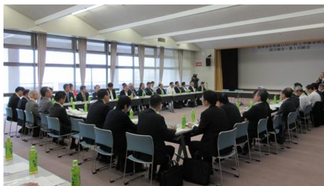
△設立総会・第1回総会開催の様子