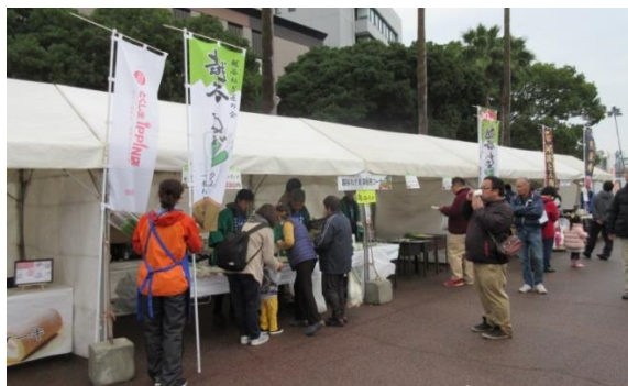
△とくしま食材フェア2017の様子