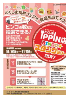
△スタンプラリーのチラシ