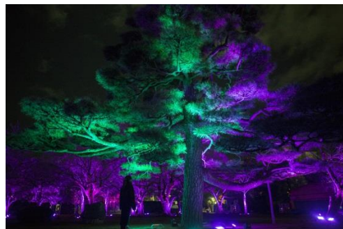
△シンボルアート作品