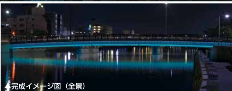
▲完成イメージ図(全景)

ひょうたん島に架かる橋などをLEDによる光の芸術作品として整備する「LED景観整備事業」の一環として、富田橋を彩るデザインが決定しました。市民や観光客の皆さんに楽しんでもらえる光の名所がまた一つ増えることとなります。