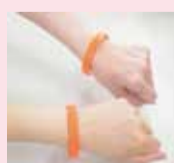
サポーターの目印「オレンジリング」