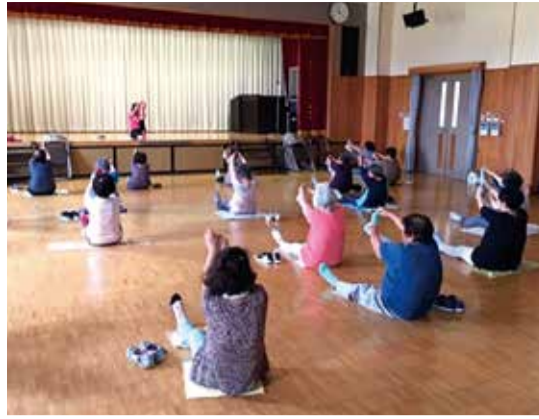
▲「元気高齢者づくり事業」運動教室での様子 運動は、何歳から始めても効果を発揮することが分かっています。まずは週1・2回、2時間程度の運動から介護予防を始めませんか。 【とき・開催場所】左表のとおり※祝日や天候などで休みになる場合があります。各教室の定員は協力NPO法人へお問い合わせください

筋肉・骨・関節などの運動器の働きが衰えると、自立度が低下して介護が必要になったり、寝たきりになったりする可能性が高くなります。徳島市では、