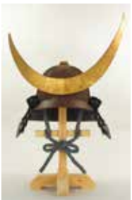
▲鉄錆地六十二間筋兜 三日月前立