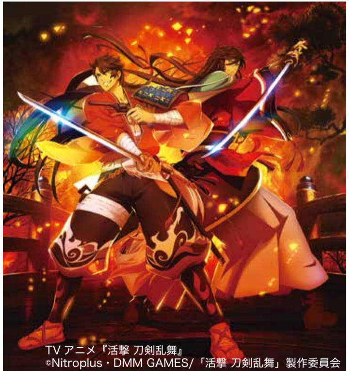
TVアニメ『活撃 刀剣乱舞』 ©Nitroplus・DMM GAMES/「活撃 刀剣乱舞」製作委員会