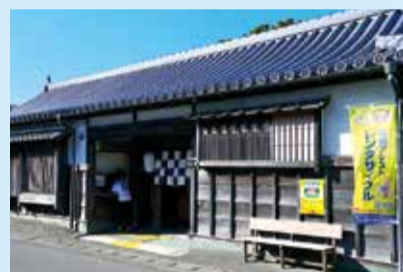
▲阿波十郎兵衛屋敷