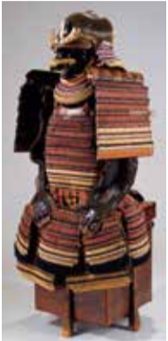
▲小札紫系威白糸腰裾取胴丸具足