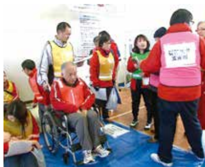
▲昨年12月の徳島市民総合防災訓練の様子

1月17日は、平成7年に発生した阪神・淡路大震災にちなんで制定された「防災とボランティアの日」です。そして、この日を含む1月15日～21日は「防災とボランティア週間」と定められています。