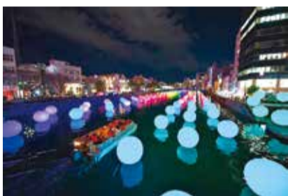
▲徳島LEDアートフェスティバル2016の様子

平成30年2月9日(金)~18日(日)に開催する「とくしまLED・デジタルアートフェスティバル」