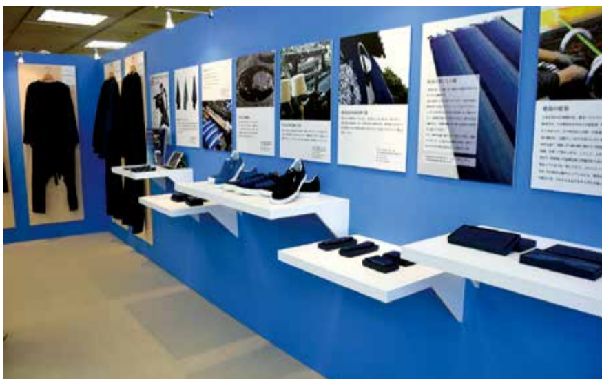
▲阿波藍で染めたスニーカーや革製品、メンズブランドとのコラボ企画で製作した商品サンプルなどを展示

プロモーションを行いました。この展示会は、今回で35回目の開催で、独自の基準による出展ブランドの選定と地場産業エリアやマーケットエリアなどテーマ別に分かれたフロア構成が好評です。約450のブースには地場産業製品や伝統工芸品、デザイン性の高い衣服・アクセサリなどが展示され、国内外のメーカーやクリエイターなどを中心に約2万1000人が訪れました。