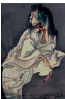
▲累怨霊の図(部分)大念佛寺蔵

◆特別展関連イベント ▽ナイトミュージアム「暗闇の中で幽霊画を見てみよう」 【とき】 11月10日(金)①17時～②17時～15時