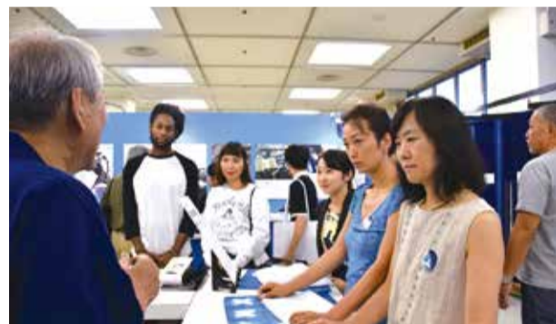
▲藍染めの説明を聞く来場者の様子

今回、特別にロサンゼルスで活躍するメンズブランドの製品を市内事業者が藍で染めて展示したほか、市内の伝統工芸士による藍染めの技法などの解説や来場者向けの藍染め体験も開催しました。 市内事業者が染めた製品に対し、ブランドからは「海外ではできないクオリティで、素晴らしい染め上がりだ」と熟練の技術が高く評価するコメントがありました。 そのほか、本市ブースを訪れた国内外の来場者からも、「日本の色だし、取り入れやすい良い色だと思う」「阿波正藍しじら織を製品に取り入れてみたい」などの声があがっており、メーカーなどに向けて藍の持つ色合いや素材