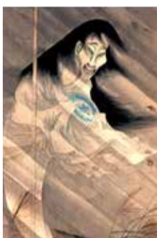
▲血屋敷お菊亡霊図(部分)大念佛寺蔵

【ところ】 徳島城博物館※現地見学は上記参照 【定員】 45人程度(抽選) 【参加費】 1,000円(全3回分。現地見学は別途6,000円程度必要) 【申し込み方法】 10月31日(火)(必着)までに、はがきに「城郭講座希望」と明記し、住所、名前、年齢、電話番号を書いて、徳島城博物館(〒770-0851 徳島町城内1-8 ☎656-2525)へ。