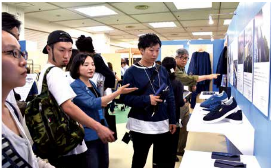
▲徳島市のブースで阿波藍の技法や製品の説明を聞く来場者の様子

9月6日～8日の3日間、東京都品川区にある複合施設で開催されたファッションとデザインの合同展示会「Rooms EXPERIENCE」に、徳島市が初出展し、阿波藍の