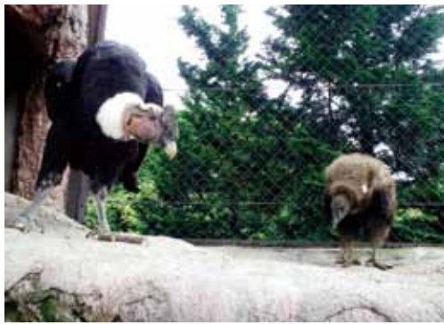
▲アンデスコンドルのココ（右）とテツ（左）

とくしま動物園でことし4月に誕生したアンデスコンドル（メス）の愛称が、このほど公募により「ココ」に決まりました。