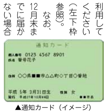
▲通知カード(イメージ)

11月末ごろをめぐりにマイナンバーを記載した通知カード(右下図参照)を全世帯に転送不要の簡易書留で郵送します。必ず受け取り、有効に