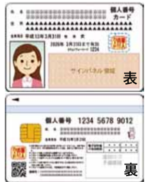
▲個人番号カード(イメージ)