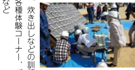
▲国府地区での訓練風景

【問い合わせ先】 教育研究所 ☎(621) 5432 FAX(624) 2577