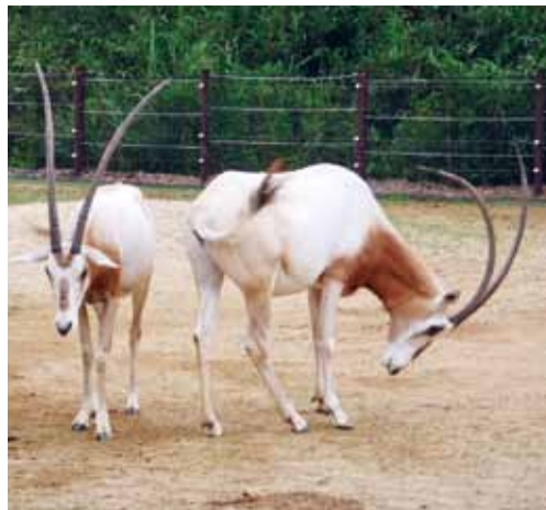
▲新しく公開されたシロオリックス「ユリナ」(写真左)と「アキナ」(写真右)

シロオリックスはウシ科でサーベルのように曲がった長い角を持っているのが特徴で、アフリカ北部に生息しています。昼行性の動物で、日中は暑さを避けて