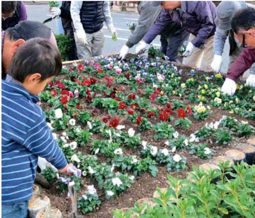
▲道路の植樹帯で花を植える参加者