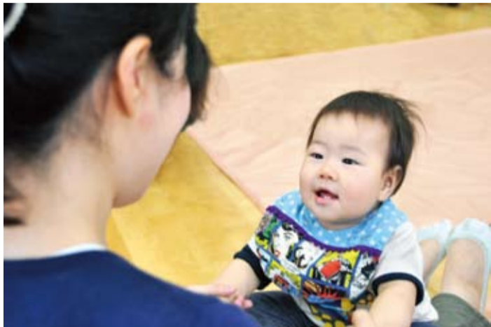
▲子どもが健やかに成長できる社会づくりを目指します

国は、幼児期の学校教育・保育や、地域の子ども・子育て支援を総合的に推進するため、「子ども・子育て支援新制度」を平成27年度から実施する予定です。