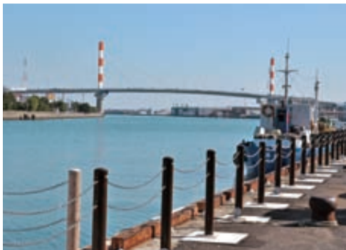
▲水辺の夢プログラムの開催場所となる万代中央ふ頭

我が家の焼け跡へ戻ると、防空壕(ごう)があった辺りを、涙をぬぐいながら木ぎれで掘っている父がいて、みんなでうれし泣きをしながら抱きついた。家族7人、けがもなく再会できたことが唯一の慰めだった。