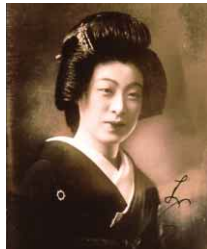
▲若き日のお鯉さん

徳島市では、「お鯉の会」と市教育委員会との共催で、徳島城博物館において、お鯉さん「お別れ会」を開催します。