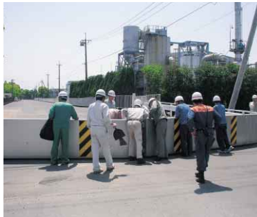
▲雨のシーズンを前に実施された樋門の点検

梅雨に入り、間もなく台風シーズンを迎えます。これから雨の多い季節になりますが、長雨や大雨により発生危険度が高ま