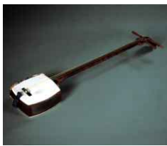
▲お鯉さん遺愛の三味線

徳島市では、「お鯉の会」と市教育委員会との共催で、徳島城博物館において、お鯉さん「お別れ会」を開催します。