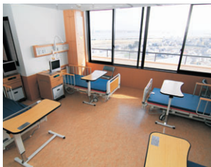
▲すべてのベッドが窓に面し、快適さが向上した病室