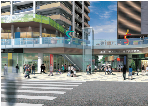
東新町側から見た自由通路のイメージ

(前月比) 人口 260,507人 (+7) 男 123,916人 (-19) 女 136,591人 (+26) 世帯数 110,213世帯 (+36) 面積 191.39km 2