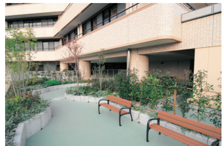
▲屋外でゆったりリハビリができるリハビリ庭園