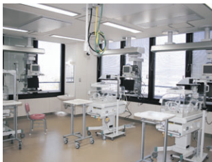
▲小さな命をしっかり守る充実のNICU