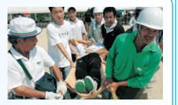
▲市民総合防災訓練の様子(昨年8月、加茂名小学校)