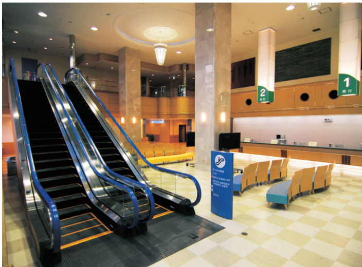
▲ユニバーサルデザインを基本とし、分かりやすく使いやすい玄関ホール

市民病院では、新病院への移転作業に伴い、1月25日(金)を外来休診日とし、救急の受け入れも1月25日(金)0:00～28日(月)8:30の間、停止させていただきます。休診、救急受け入れ停止の間は、診療可能な病院をご案内します。 【問い合わせ先】市民病院医事課(☎622-5121)