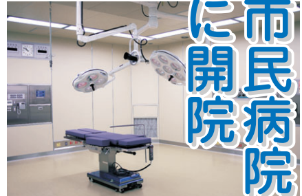
▲急性期病院にふさわしい充実した手術室