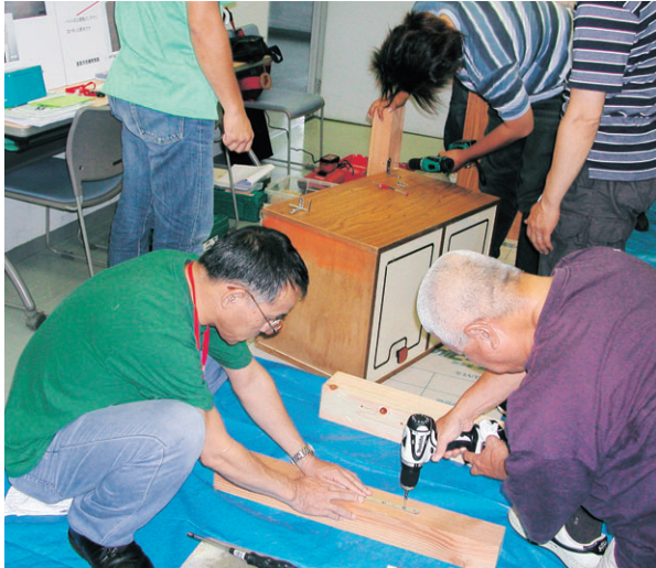
家具転倒防止実践講座の様子(とくしま県民活動プラザ)