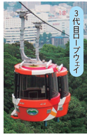
3代目ロープウェイ

徳島市のシンボル「眉山」山頂への交通手段として、これまで多くの人々にご利用いただき、開設50周年を迎えることになりました。