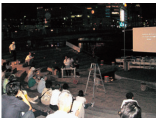
第1回都市デザインセミナー(8月)

◆かがやき徳島スポーツ交流フォーラム事業 【主催】NPO法人スペシャルオリンピックス日本・徳島 【協働関係課】福祉課 ☎(621)5177・スポーツ振興課 ☎(621)5427 ◆事業目的 知的発達障害のある人、ボランティア、企業が一緒にスポーツを通して交流すること