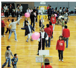
フォーラムで行う予定の風船パレーボール

◆進展状況 ①家具転倒防止技術の普及啓発イベント・広報の実施 ②器具の取り付け方などを学ぶ、一般市民向け「実践講座」を9月に開催 ③地域ぐるみで地震対策を学びたい町内会などに対し「出前講座」の実施 ④各地域に根ざした家具転倒防止ボランティア「いざいそなえ隊」(現在、27人が登録)の育成と隊員の募集 ⑤防災指導時に活用する「家具転倒防止事例パネル」の作成など。