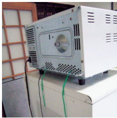
電子レンジと台をつないで転倒防止

◆進展状況 ①家具転倒防止技術の普及啓発イベント・広報の実施 ②器具の取り付け方などを学ぶ、一般市民向け「実践講座」を9月に開催 ③地域ぐるみで地震対策を学びたい町内会などに対し「出前講座」の実施 ④各地域に根ざした家具転倒防止ボランティア「いざいそなえ隊」(現在、27人が登録)の育成と隊員の募集 ⑤防災指導時に活用する「家具転倒防止事例パネル」の作成など。