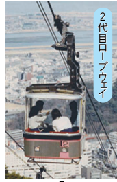
2代目ロープウェイ