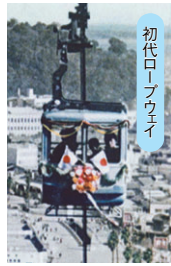
初代ロープウェイ