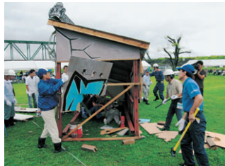
防災訓練に取り組む地域の皆さん(昨年)

徳島市では、毎年9月1日に各防災関係機関参加のもとに実施していた総合防災訓練を「徳島市民総合防災訓練」と変更し、今年度からは、市民の皆さんが主体となった訓練を行政区単位で実施していきます。「自助」はもちろん、地域に