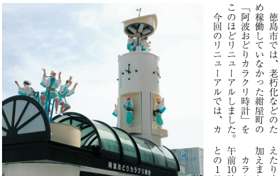
▲リニューアルされた「阿波おどりにカラクリ時計」

徳島市では、老朽化などのため稼働していなかった紺屋町の「阿波おどりにカラクリ時計」を、このほどリニューアルしました。今回のリニューアルでは、これまでとは異なり、カラクリ時計が作動するのは、午前10時～午後8時の2時間ごと。この1日6回。影絵は午後6時と午後8時の1日2回です。