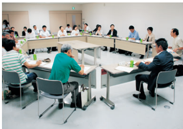
▲市長と意見を交わす参加者の皆さん

「観光×協働による魅力づくり」をテーマに、市民の皆さんと市長がまちづくりについて話し合う機会が、7月24日、ふれあい健康館で開催されました。