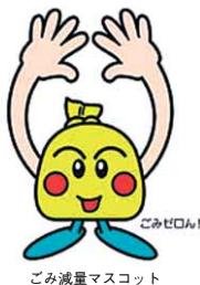
ごみ減量マスコット

徳島市では、ごみの減量とリサイクルを推進するため、資源ごみ回収運動を実施しています。これは、集団回収を行った団体に対し、回収量に応じて奨励金を交付するもので、これまで、古紙類、アルミ缶などの金属類、布類、びん類を対象品目としていましたが、平成19年度からは廃食用油(あぶら)も回収の対象となりました。廃食用油に対する奨励金は、1kgあたり12円(古紙類、アルミ缶等は従来どおり6円)です。