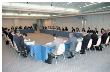
▲昨年、開催した「徳島市総合計画市民会議」

私は、この「心おどる水都・とくしま」という本市の将来像を、市民の皆様としっかりと共有し、心をつなげて、このまちに生まれてよかった、住んでよかったと心からしあわせを実感できる新しい徳島のまちづくりに向け、全力で取り組んでまいります。