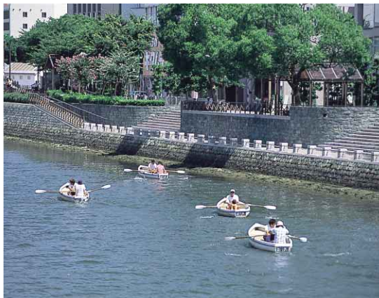
水際公園などの整備と市民の美化活動で新町川は「水の都・徳島」のシンボルとしてよみがえりました。

「マイシティとくしま」(四国放送テレビ) 毎週日曜日 11:50~正午放送 「こんには徳島市です」(ケーブルテレビ徳島) 毎日4回週替わりで放送