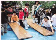
ゲームを楽しむ子どもたち

【とき】5月5日(祝) 10:00～15:00 【ところ】徳島中央公園(雨天の場合は、中央公民館) 【内容】市内青少年団体によるパントワングや鼓笛演奏、各コーナーでのおもちゃ作りやチャレンジランニング、スポーツ、もちつき、お茶席など。 ※参加は無料です。 【問い合わせ先】社会教育課 ☎621-5417