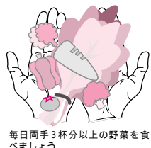
毎日両手3杯分以上の野菜を食べましょう

食事は、栄養バランスを考慮し、主食・主菜・副菜をそろえ、野菜は、1日300g以上(目安は生の状態で1日に両手