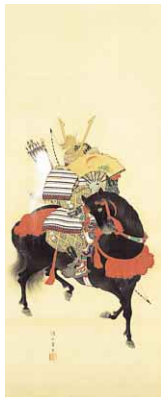
武者図(部分)、守住貞魚筆