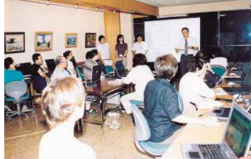
ショッピングセンターでのパソコン教室風景

ン中継速報、棚田での稲作づくりなど、多様な活動内容のレポートが人々の笑顔やコメントとともに掲載され、人や自然、ものづくりなどのさまざまな情報に出会えます。 「ITの強みの一つは速報性。市民が参加し活用する