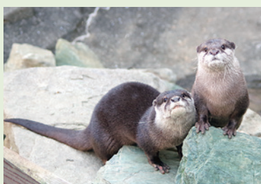
▲そぼろ(左) てまり(右)

温帯区には、令和5年12月にコツメカワウソの男の子「そぼろ」が来園しました。当園にすっかり慣れて寒い日もパドックを走り回り、ペアの「てまり」との仲睦まじい姿も見られるようになりました。