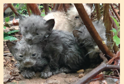
▲ 飼い主のいない野良猫