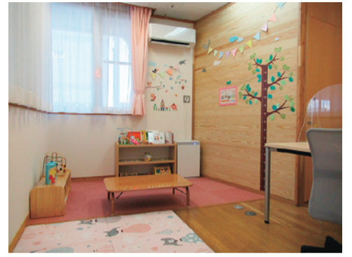
▲ほっとルーム不動の相談室

9月1日(木)、子育てに関する相談や情報提供を行う施設として、在宅育児家庭相談室「ほっとルーム不動」を市立不動認定こども園内に開設しますのでご利用ください。