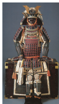
▲紫糸威胴丸具足(12代藩主蜂須賀齊昌所用)