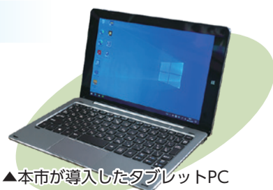
▲本市が導入したタブレットPC