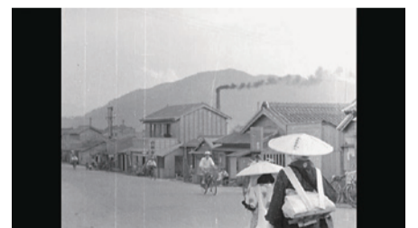
▲「新しき日本 徳島縣篇」の一場面

昭和26年ごろ撮影された記録映像「新しき日本 徳島縣篇」のフィルムが市史編さん室の収蔵品から発見されました。