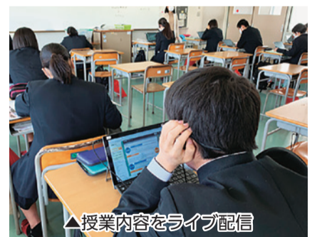
▲授業内容をライブ配信

徳島市立高等学校では、コロナ禍でクラスの半数が一日おきに登校する分散登校の実施中、家庭待機となった生徒たちはオンラインで授業に参加。ポストコロナ時代における感染拡大防止と学校教育活動を両立する新たな学びを実現しています。