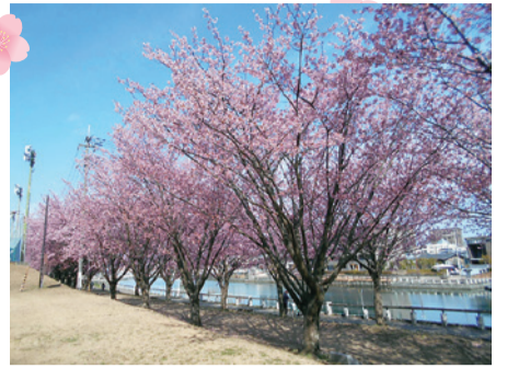
▲助任川沿いの蜂須賀桜 (昨年3月9日撮影)

これから見ごろを迎える早咲きの蜂須賀桜や3月下旬から咲き始めるソメイヨシノなどの桜の開花状況を、4月上旬まで市ホームページで随時お知らせします。