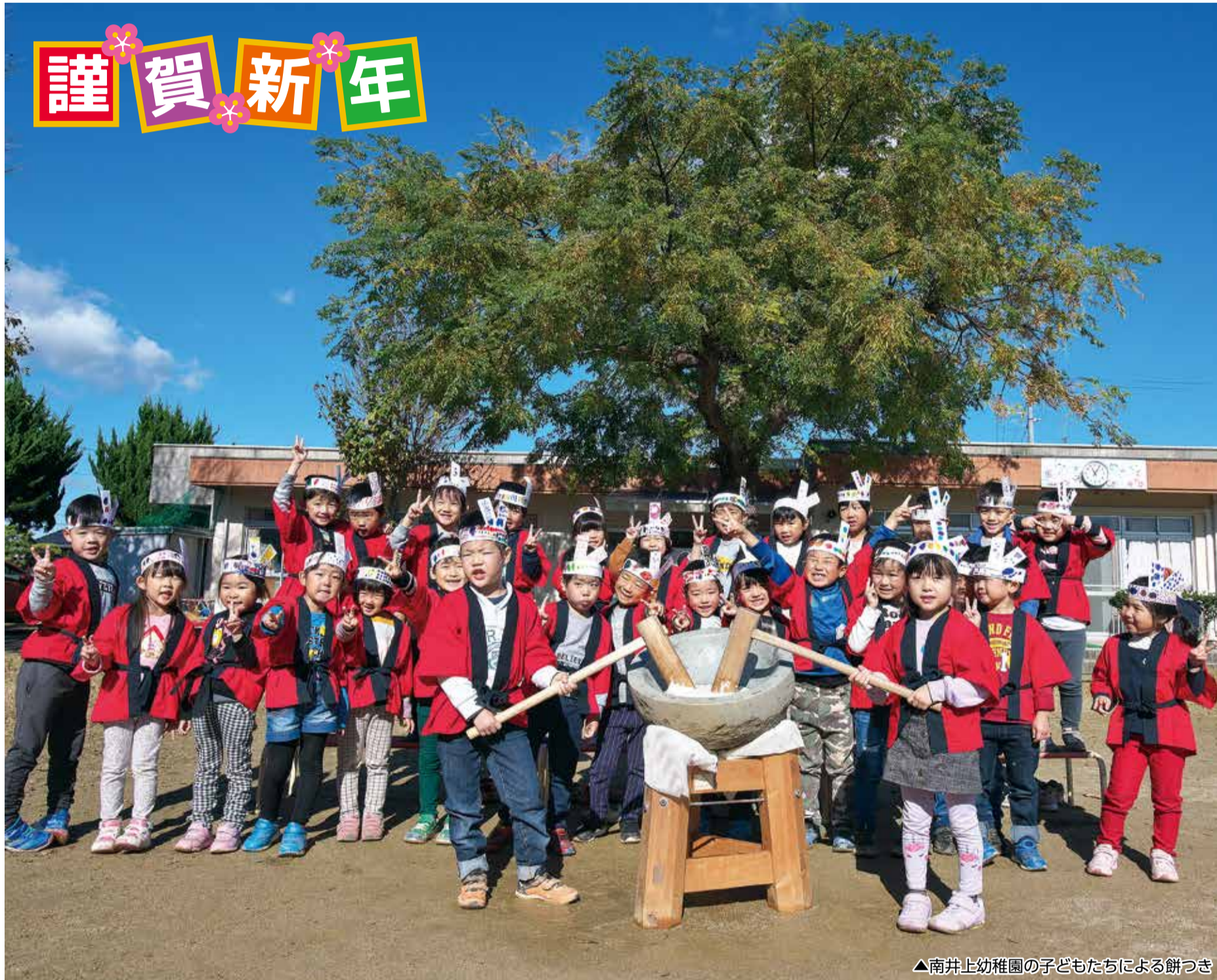
▲南井上幼稚園の子どもたちによる餅つき