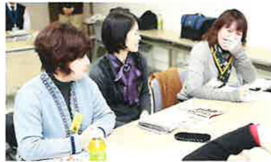
第2回べちゃくちゃ問答塾の意見をまとめて発表していただいた方々