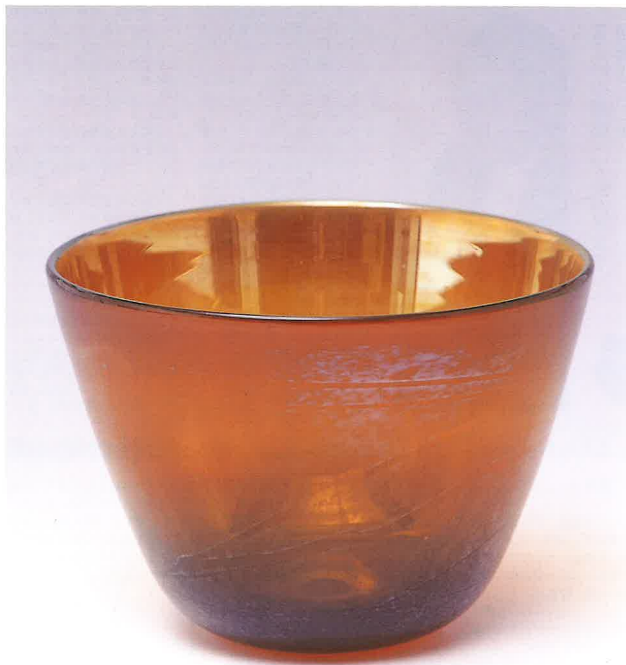
■作者名/野村 透・作品名/花生・サイズ/高さ18cm×幅22cm