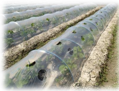
雨よけ栽培による秀品率の向上

各地域農業再生協議会が 指定する3品目（基幹作） を対象に、 生産性向上 に取り組む農業者を支援します。