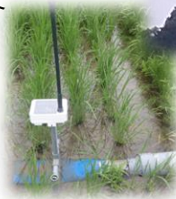
防除用ドローンや水管理システムによるスマート農業の実践

※ 支援メニュー、対象、単価、要件等について、今後の国との調整等の結果により、修正が生じ得ることにご留意ください。