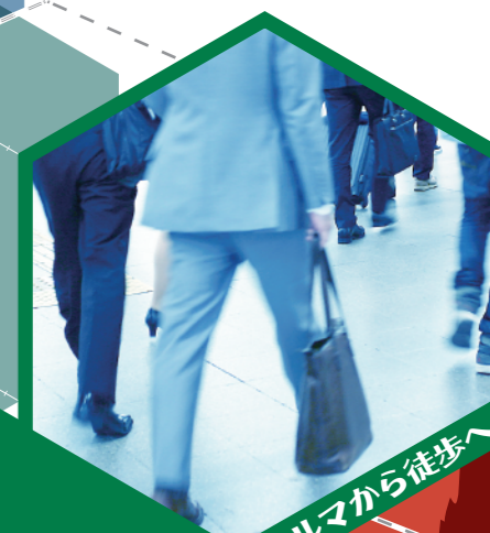
クルマから徒歩へ