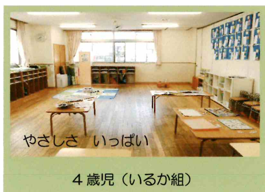
やさしさ いっぱい