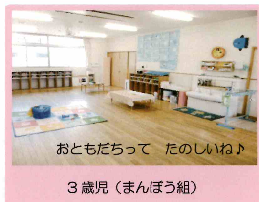
おともだちって たのしいね♪