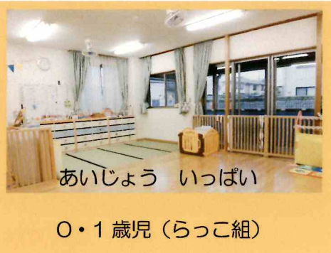
あいじょう いっぱい 0・1歳児（らっこ組）