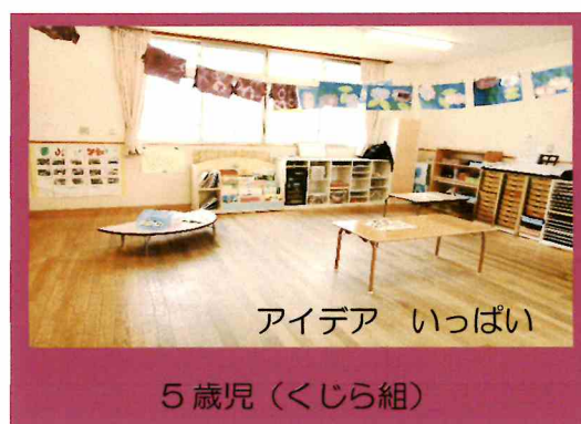
アイデア いっぱい