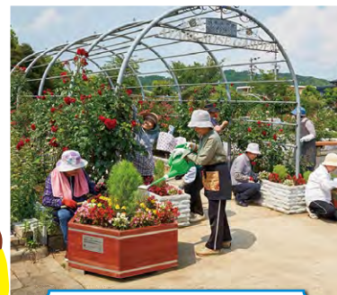
フラワープランター